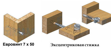
Евровинт 7 x 50